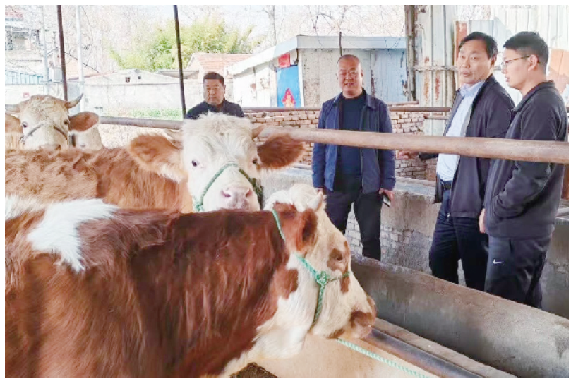
近日,农行周口分行积极支持地方特色产业发展,大力推广“惠农e贷”等信贷产品,为农户提供金融支持,帮助农户扩大生产规模。图为农行周口分行农户金融部负责人和农行鹿邑县支行负责人等在某养殖场调研。