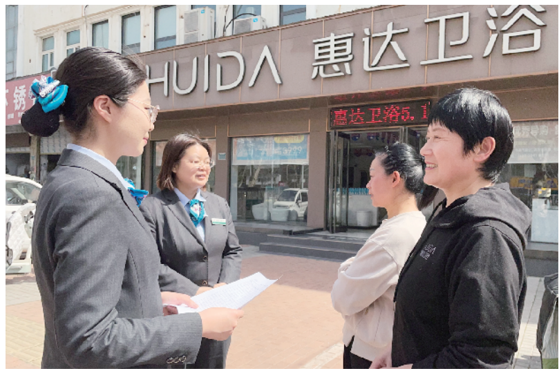
近日,农行周口分行精准施策,制订个性化金融服务方案,为个体工商户、小微企业健康发展提供金融帮助。图为农行周口西城支行工作人员在惠达卫浴门前开展金融产品宣传。