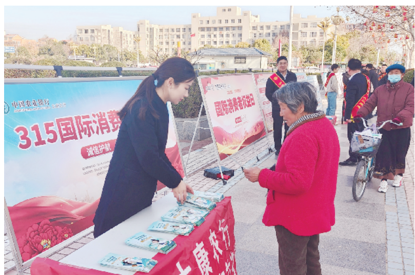
近日,农行周口分行组织辖内支行在广场、社区等人流量密集场所,向群众普及存款保险、反假币等金融知识,提高群众识诈、防诈能力。图为农行太康县支行工作人员向过往群众宣传金融知识。王鹤鹏 杨高杰 摄